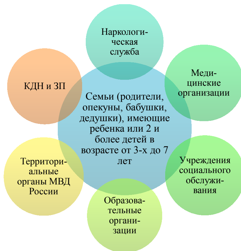
Рисунок 3. Межведомственное взаимодействие субъектов профилактики

Межведомственное взаимодействие превентивного характера для детей и семей, находящихся в группе риска, реализуется в соответствии с Федеральным законом от 24.06.1999 N 120-ФЗ (ред. от 03.07.2016) "Об основах системы профилактики безнадзорности и правонарушений несовершеннолетних" (с изм. и доп., вступ. в силу с 01.01.2017).