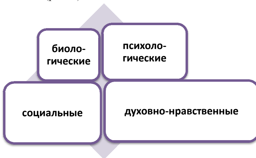
Рисунок 1. Группы факторов, влияющие на вовлечение в употребление ПАВ

В приобщении к ПАВ и формировании химической зависимости решающее значение имеет совокупность биологических, социальных и психологических факторов, провоцирующих вовлечение ребенка в употребление ПАВ (рис. 1).